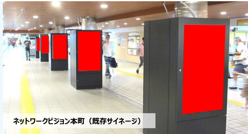
ネットワークビジョン本町（既存サイネージ）